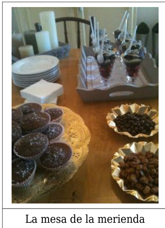
La mesa de la merienda

Untar el molde de los muffins con la mantequilla y rellenar con la masa hasta la mitad y hornear unos 20 minutos , dejar enfriar antes de desmoldar. Rellenar las copas hasta la mitad con las fresas picadas, poner sobre ellas un muffin y bañar con el chocolate blanco templado al baño maría con la nata. Decorar con bolitas plateadas. Para las magdalenas rellenar los moldes hasta la mitad y los horneas unos 15 minutos una vez frías las espolvoreas con azúcar glas.