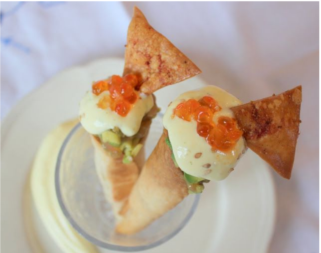
Jamoncitos de Pollo con Manzana y Reducción de Oloroso.