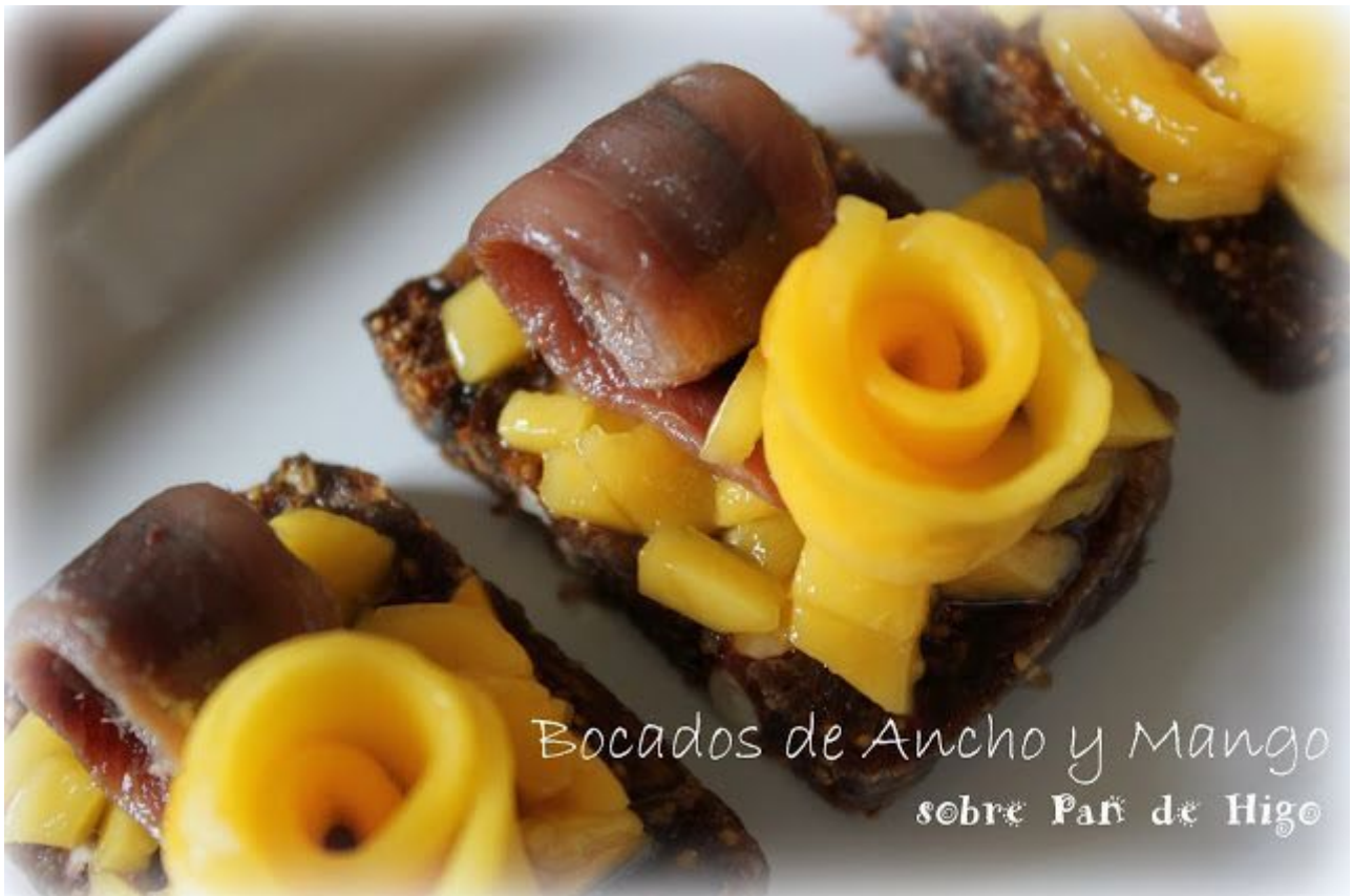
Bocados de Ancho y Mango sobre Pan de Higo

Poner encima una anchoa enrollada y al lado la florecita de mango. Os sorprenderá el sabor.