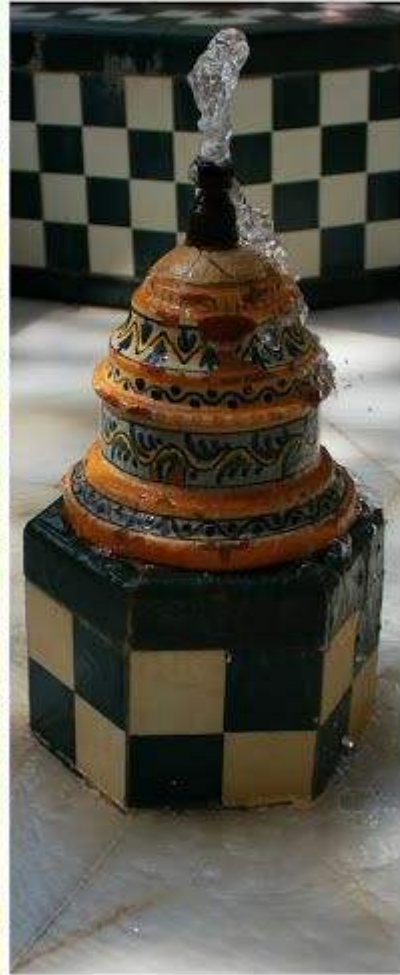
Detalles del exterior del palacete.