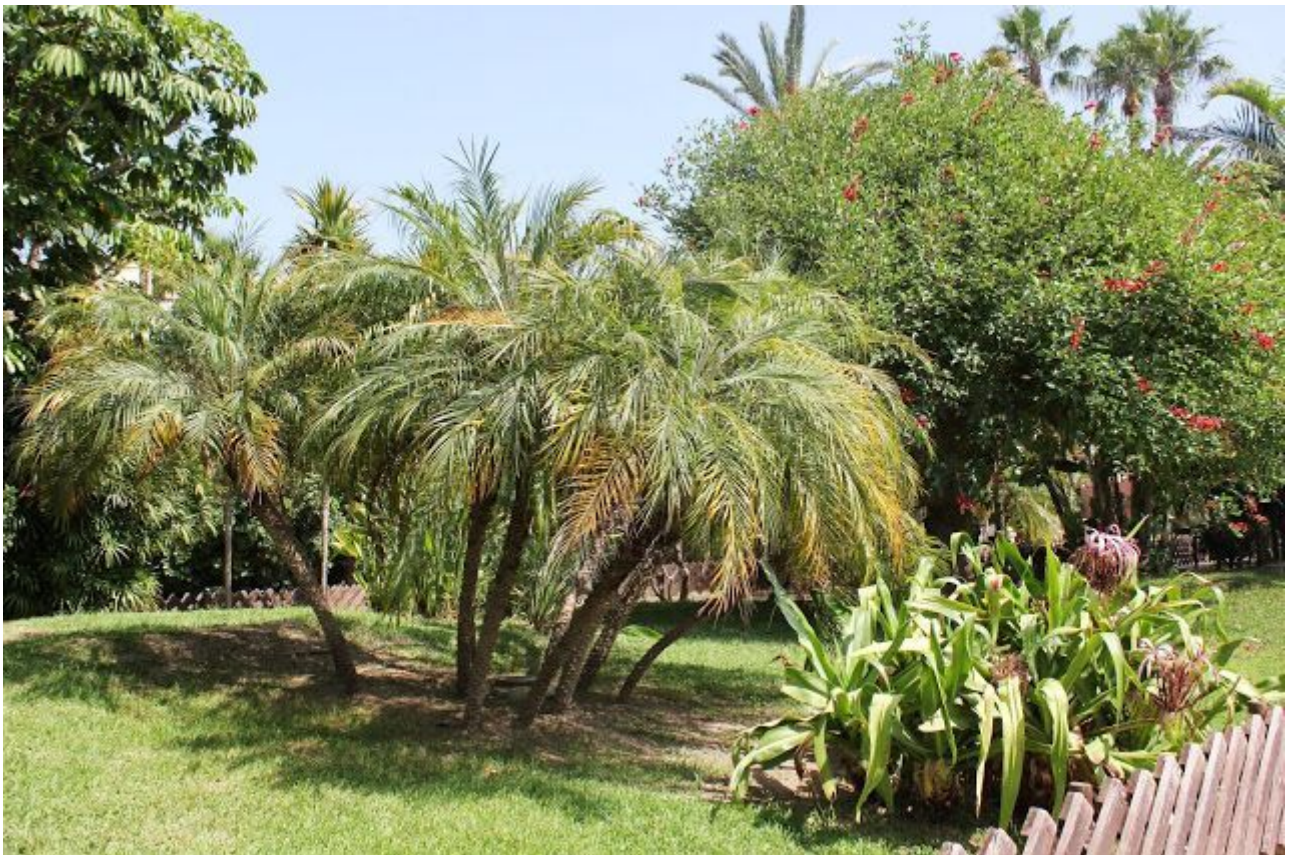
Barrio de San Miguel