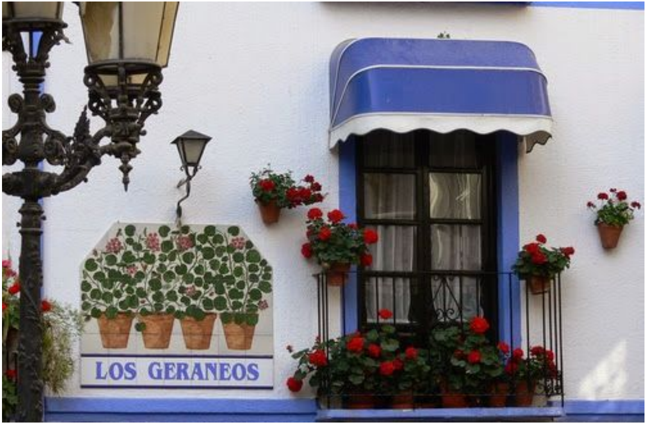
Detalle de la Fachada del Restaurante Los Geraneos.