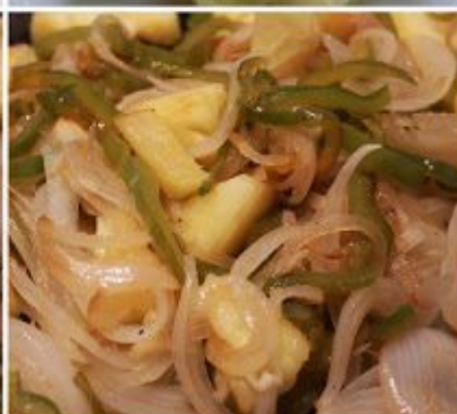
El salteado de verduras y piña.