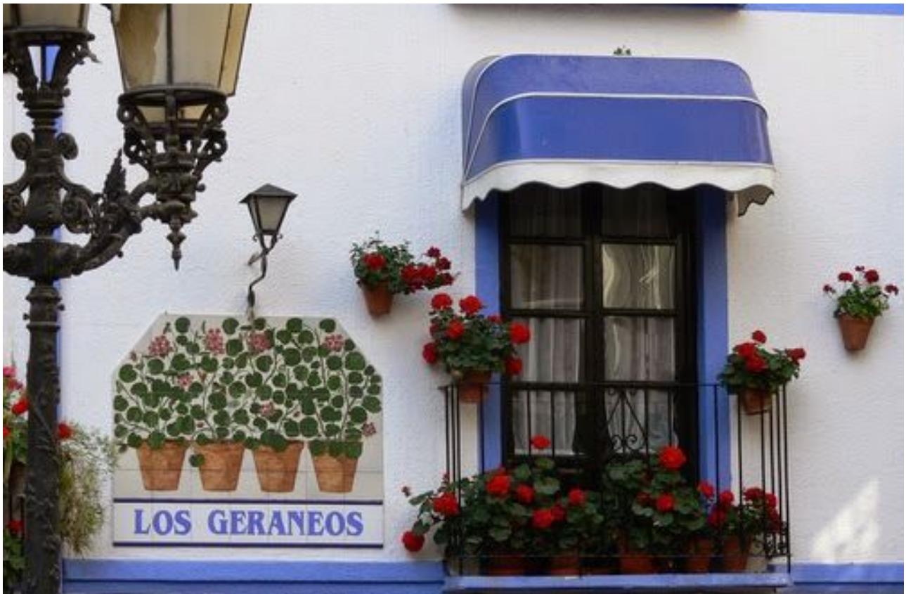
Detalle de la Fachada del Restaurante Los Geraneos.