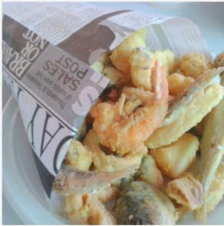
Fritura de Pescadito de «Lute y Jesus»