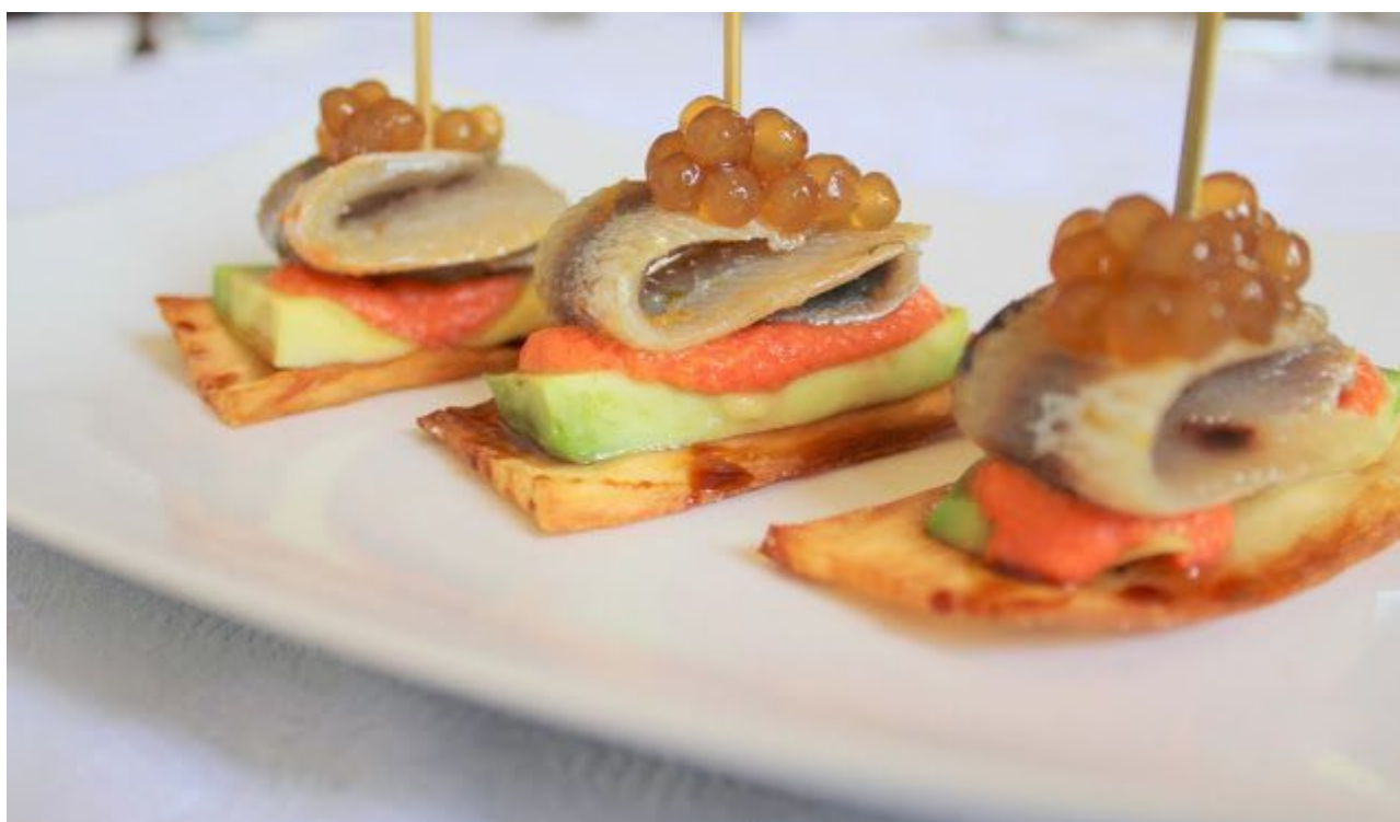
« Bocados de Majuelo Sexi »

Pero antes de las recetas os dejo unas fotos de mis platos y del lugar para demostrar que no exagero ni «mijita».