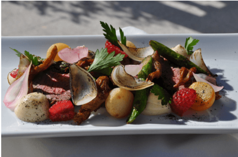
Restaurante By larius