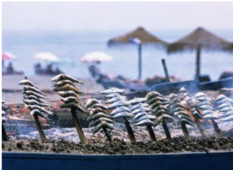
Espetos de Sardinas