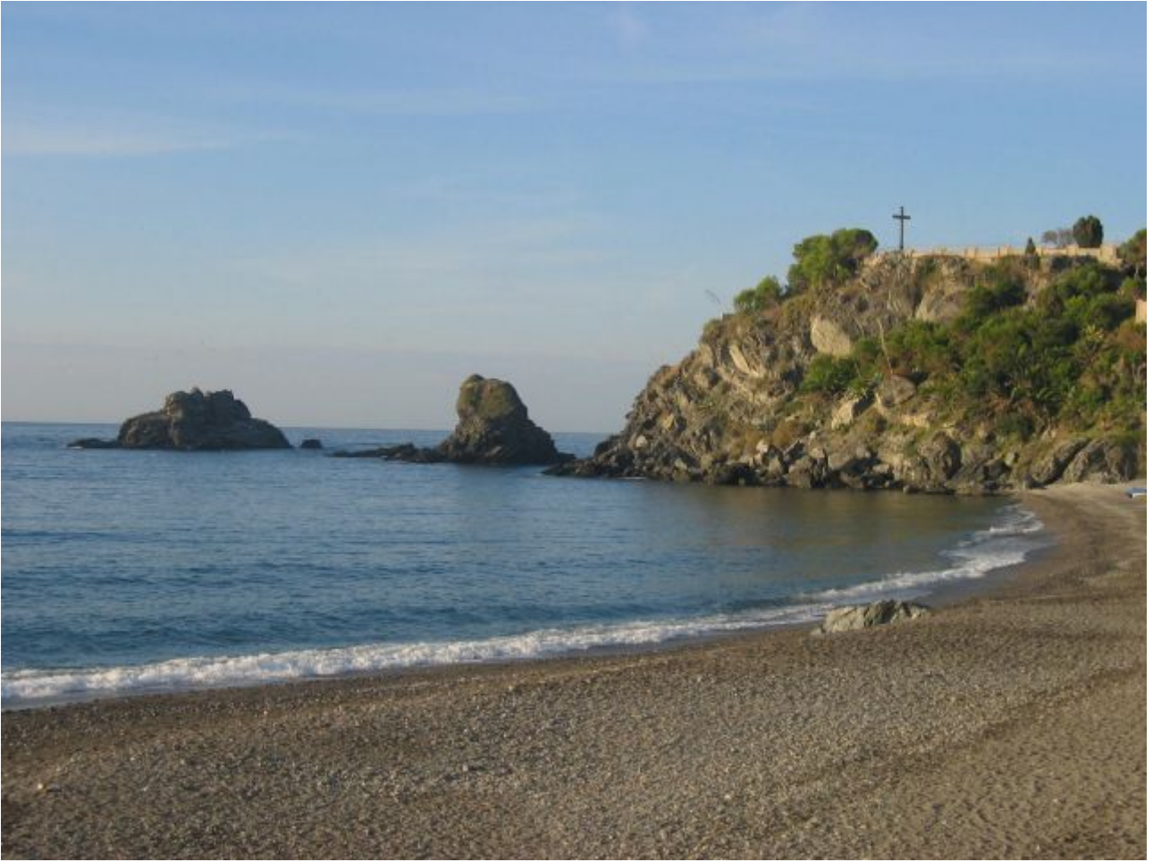
Playa de La Caletilla ( con los tres Peñones)