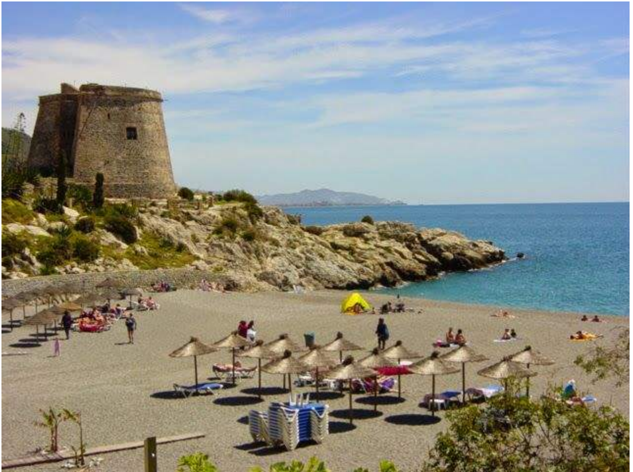
Playa del Tesorillo