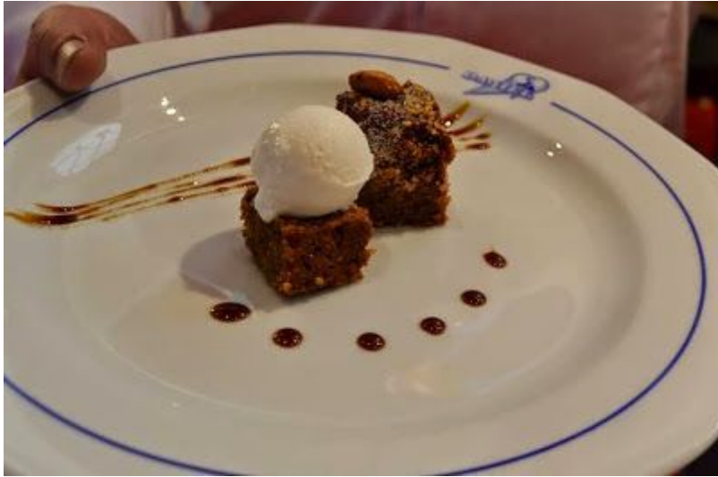
Cazuela Mohína con Helado de Chirimoya ( creación de Heladeria Daniel)