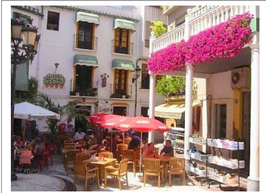
Plaza de la Rosa