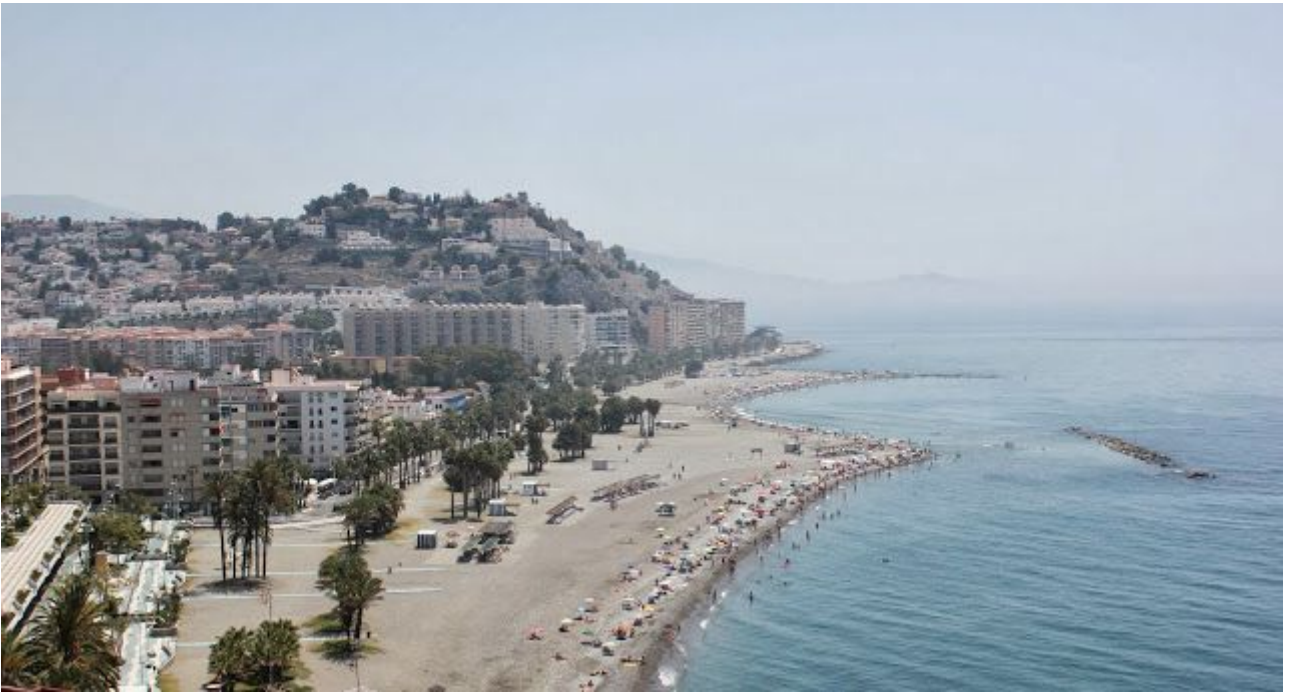
Panorámica desde el castillo