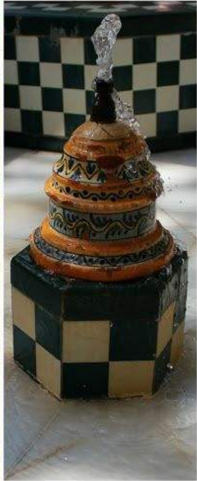
Detalles del exterior del palacete.