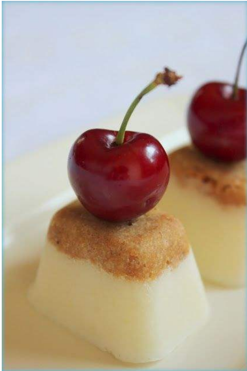
«Mini Pannacottas de Yogur y Chirimoya»