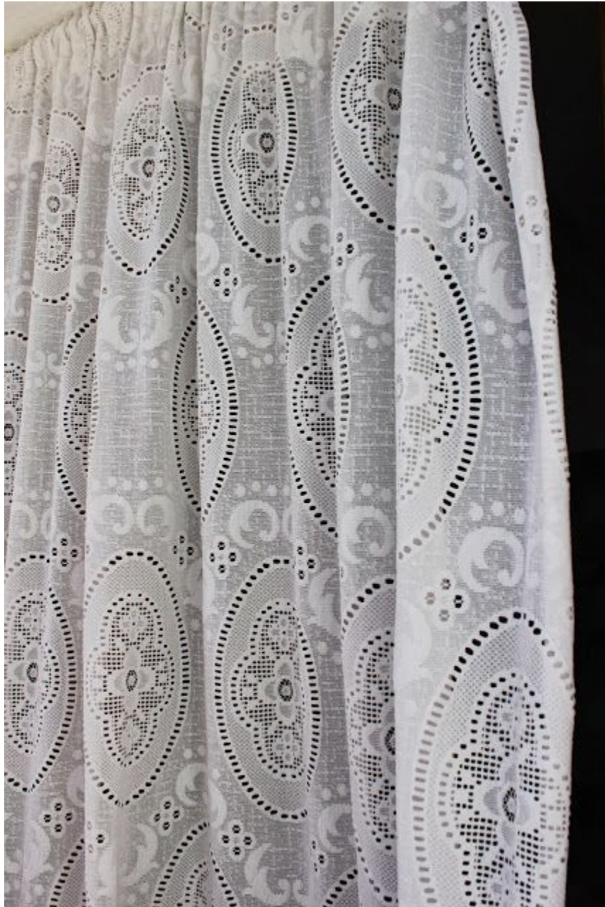
Castillo de San Miguel