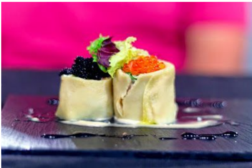
Crepes rellenos del Restaurante Kairos la Flor