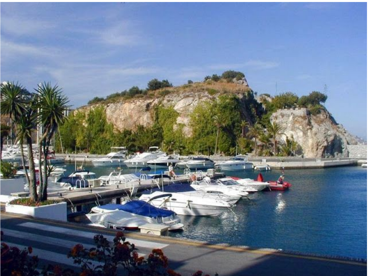
Puerto Deportivo Marina del Este ( la Herradura)