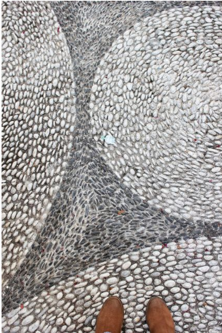
Detalle de los empedrados que abundan por sus calles.