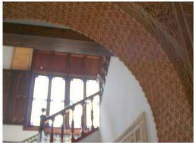
Detalles del interior del Palacete.