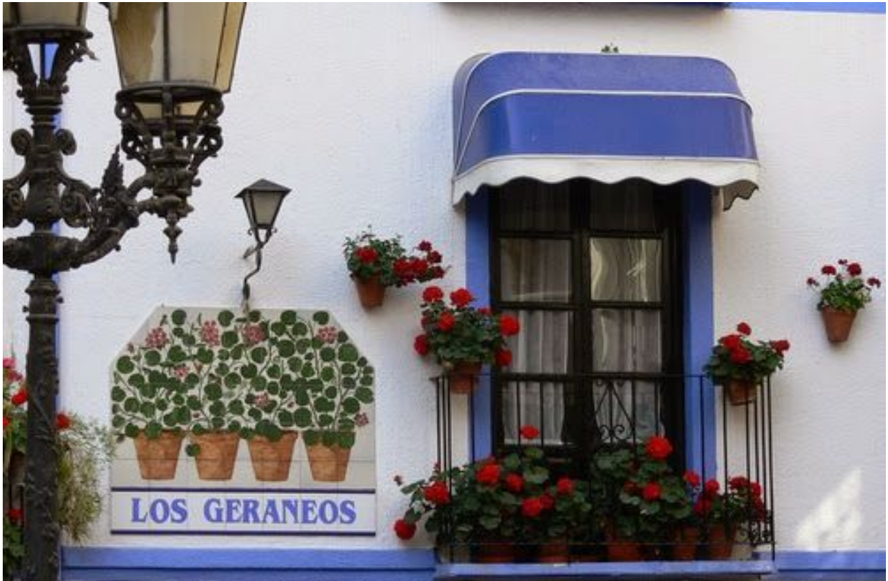
Detalle de la Fachada del Restaurante Los Geraneos.