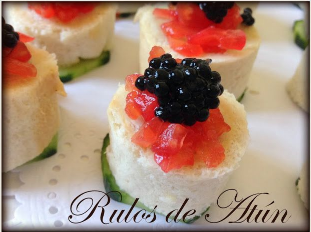
Rulos de Atún