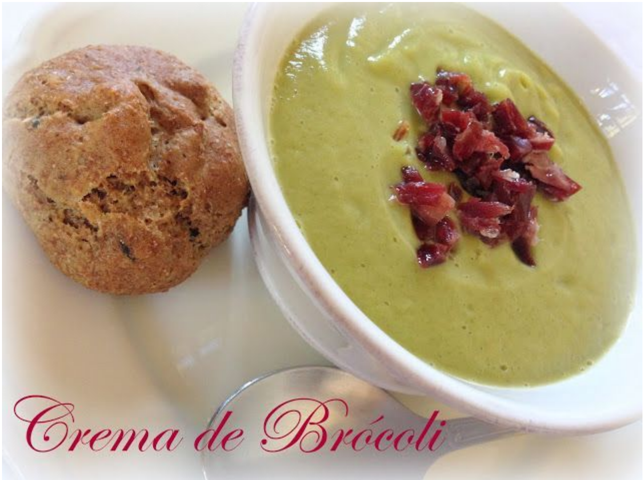
Crema de Brócoli