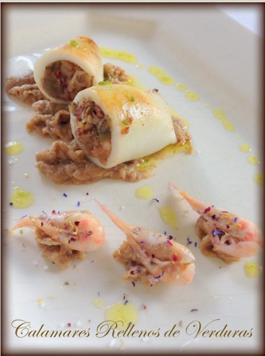
Calamares Rellenos de Verduras