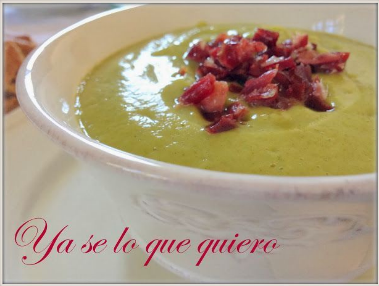
Ya se lo que quiero