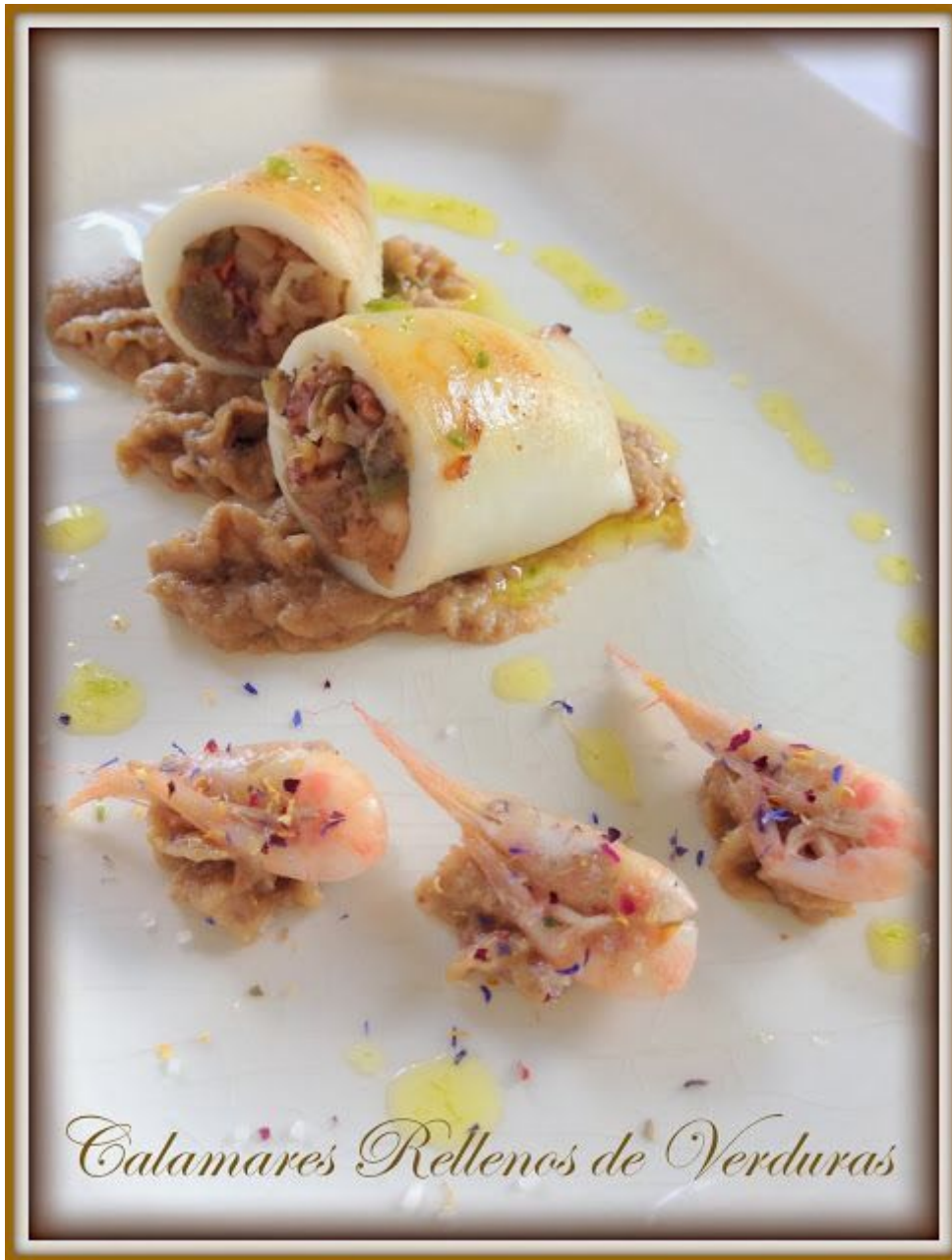
Calamares Rellenos de Verduras