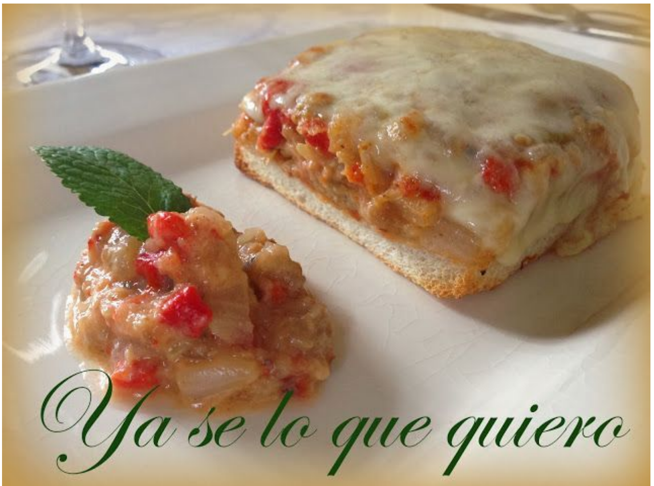
Ya se lo que quiero