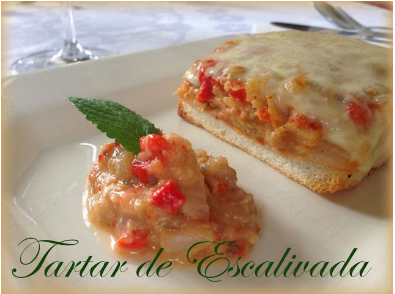
Tartar de Escalivada