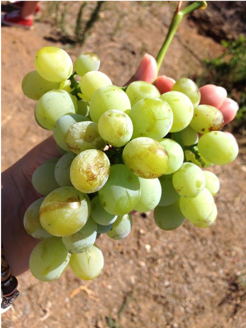
El Tesoro de Almachar