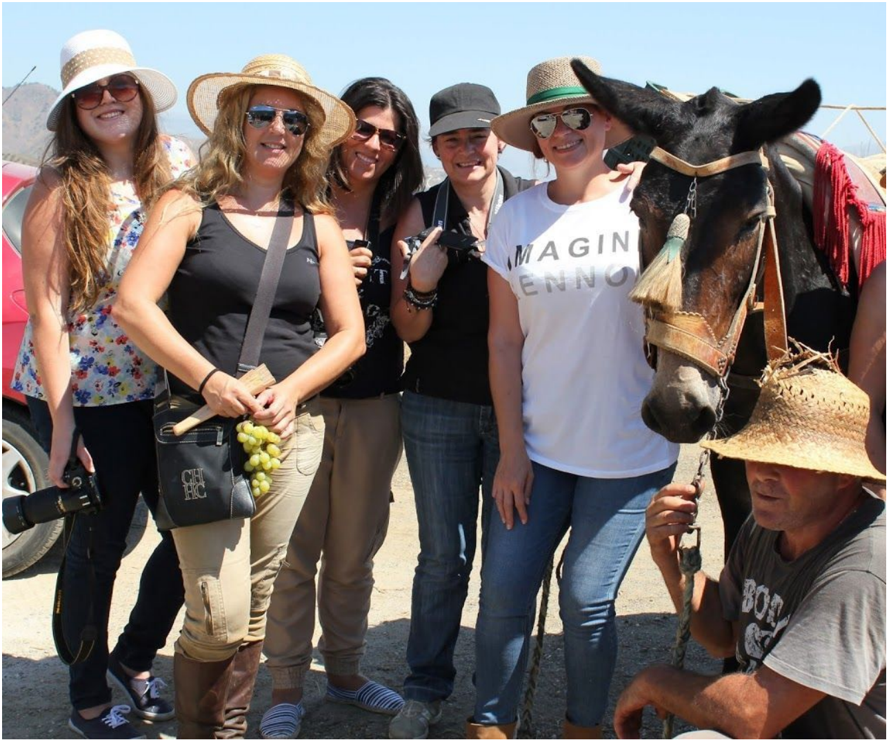
Las Bloggers de Granada