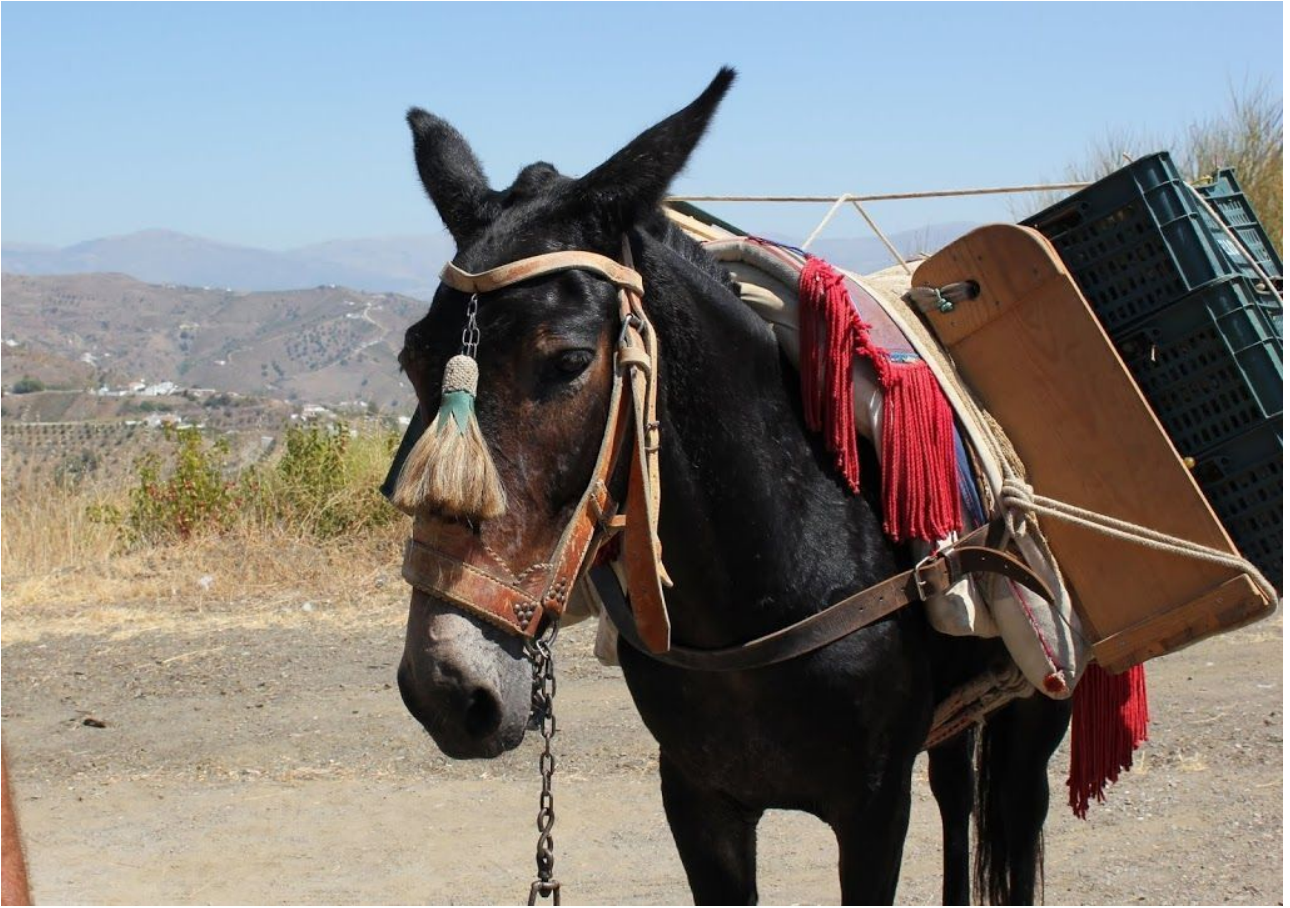
El protagonista de la mañana