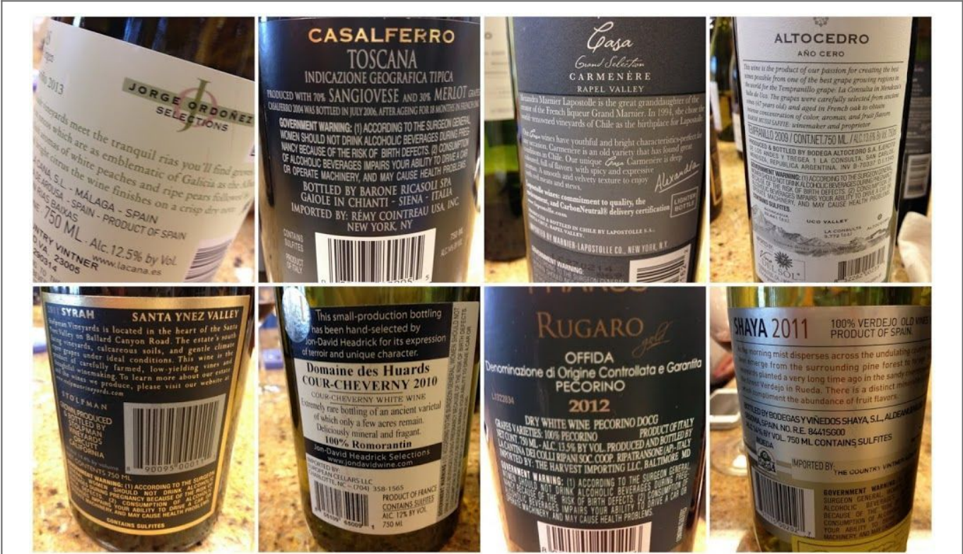
Dos españoles entre los vinos que entusiasmaron a los asistentes. Momento Orgullo Español.