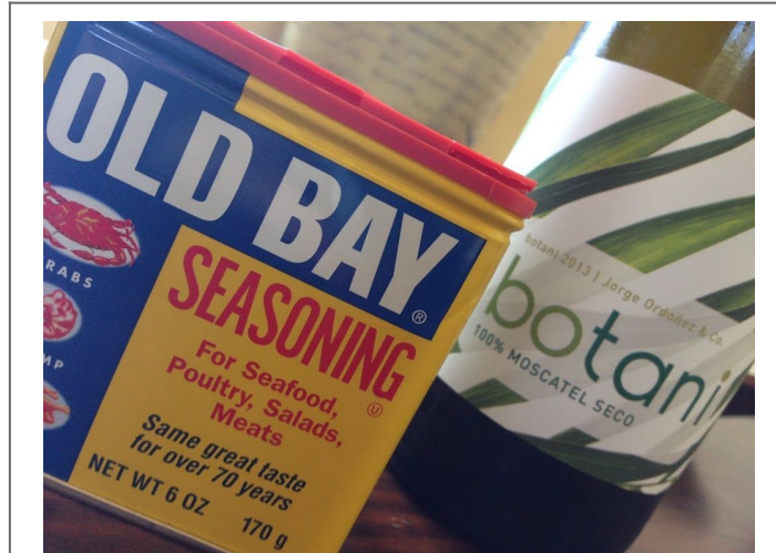
La extraña pareja

Atlántico y Mediterráneo unidos, para que disfrutes al máximo.