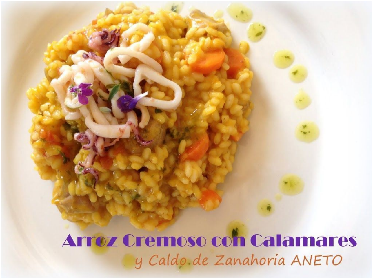
Arroz Cremoso con Calamares y Caldo de Zanahoria ANETO