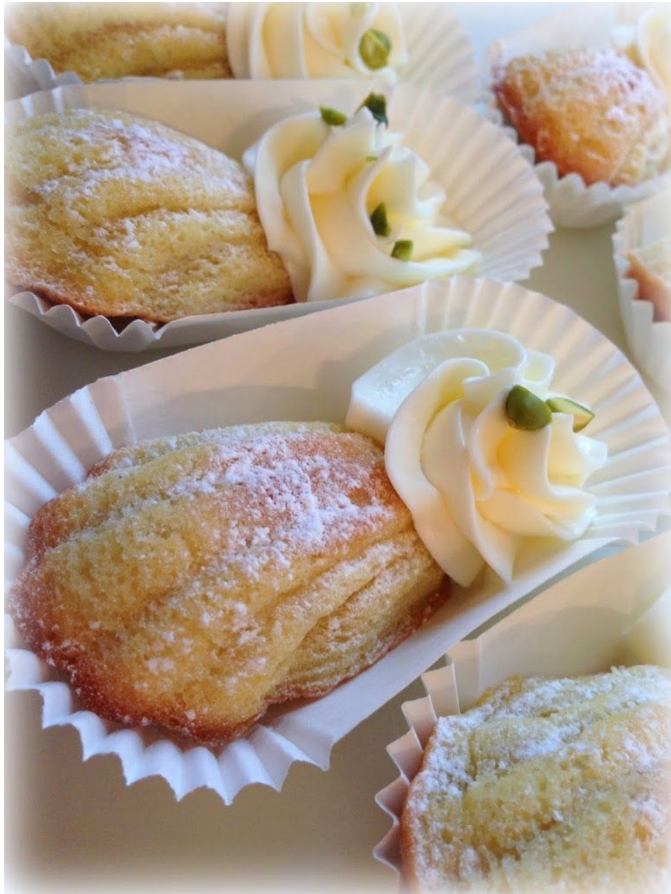
Otra sugerencia de presentación