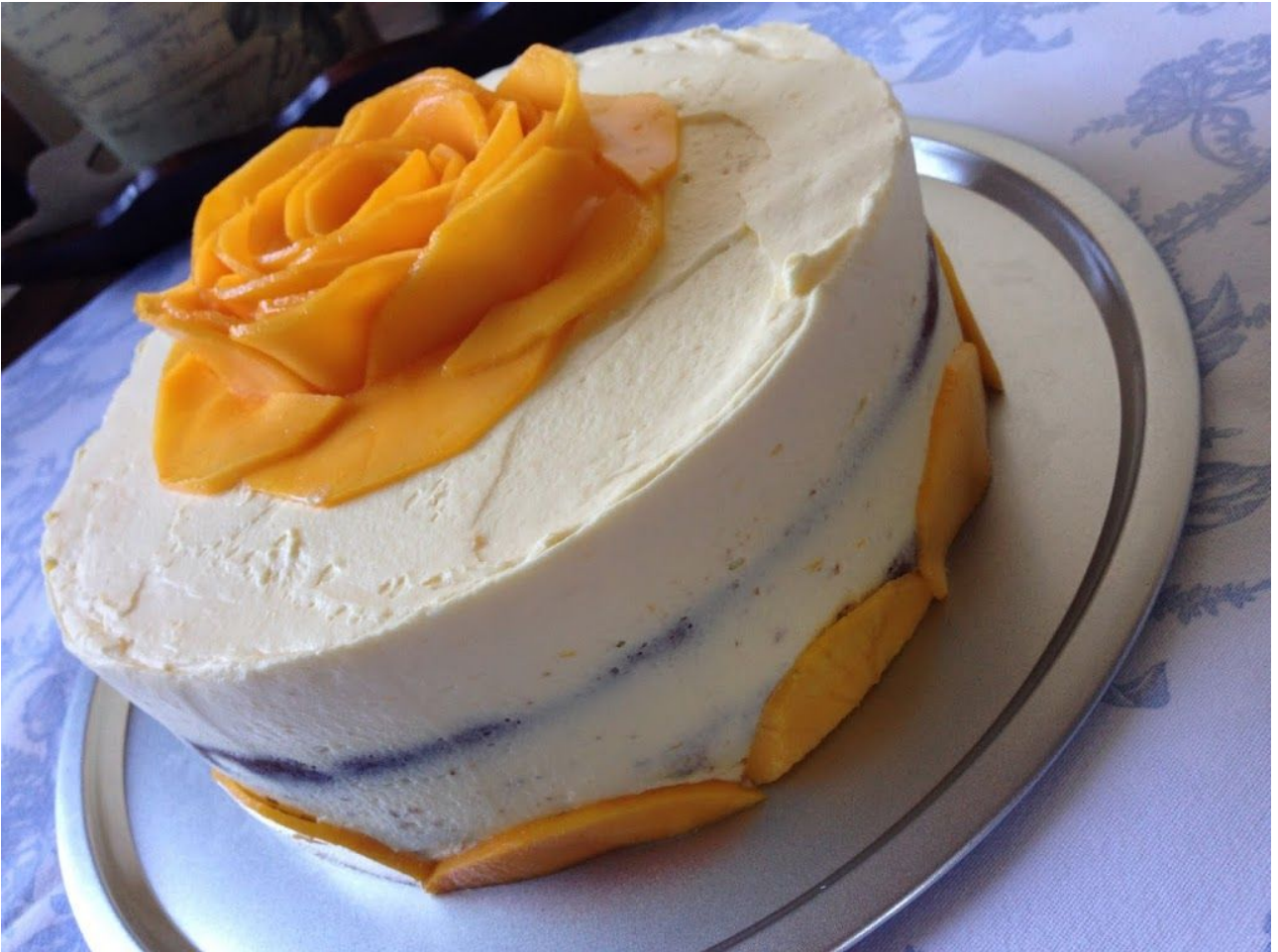
Tarta de Queso Ligera