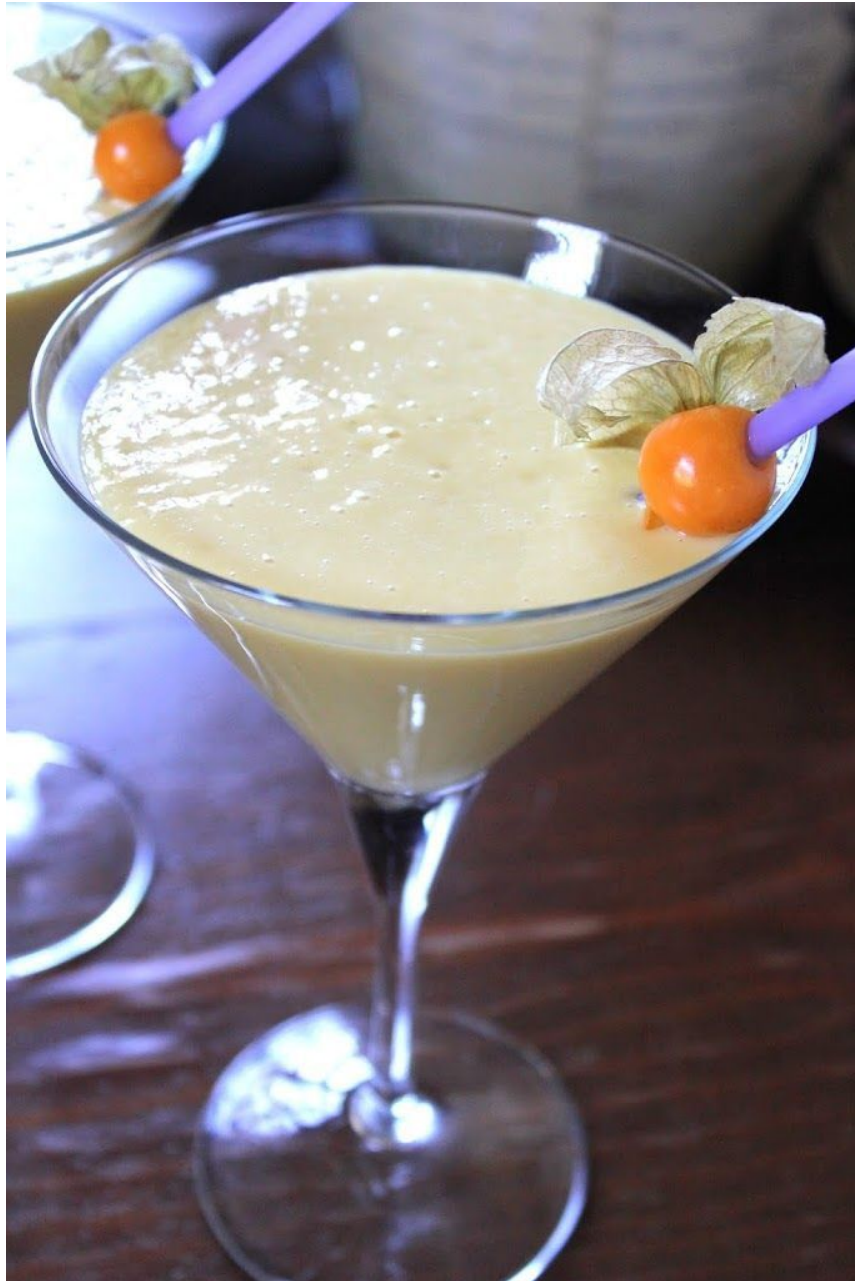
Hojaldres de melocotón con Pistachos