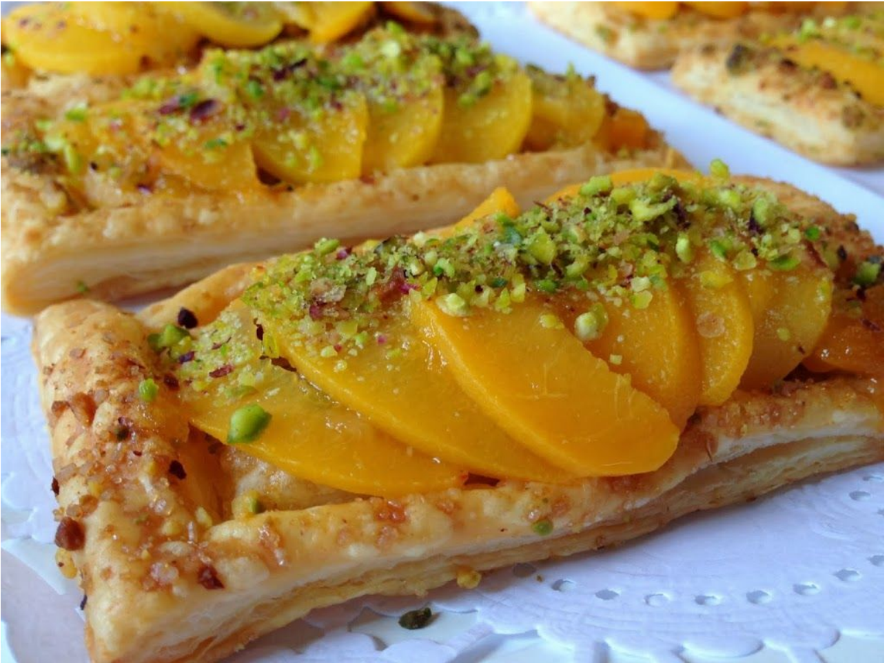
Biscocho de Mascarpone con Nata al Aroma de Vainilla