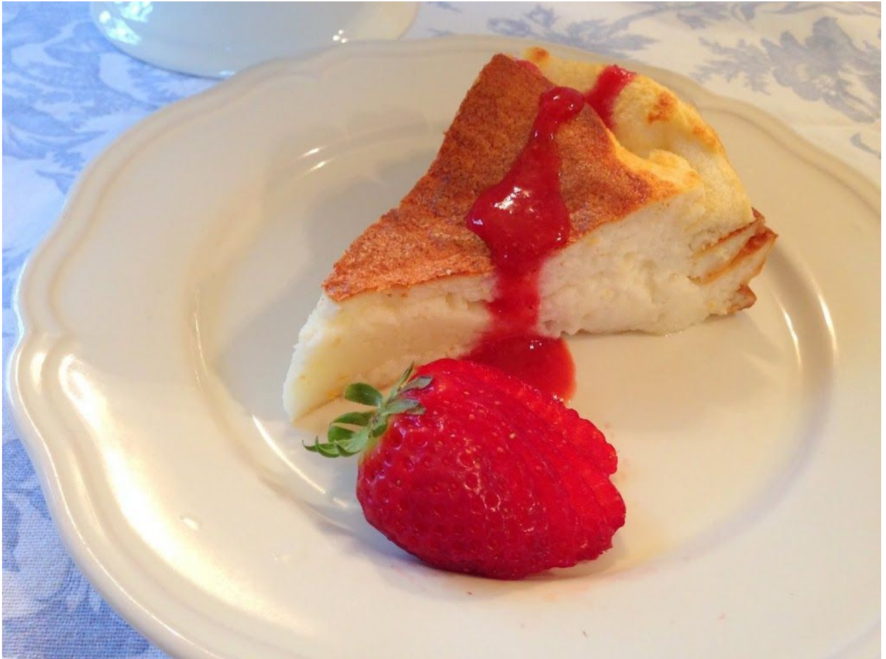
Bizcocho Cuatro Cuartos