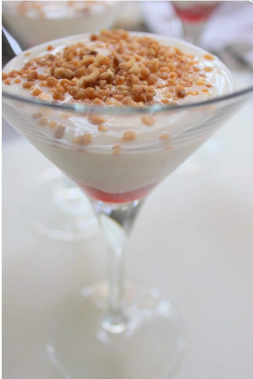
Smoothies de Mango