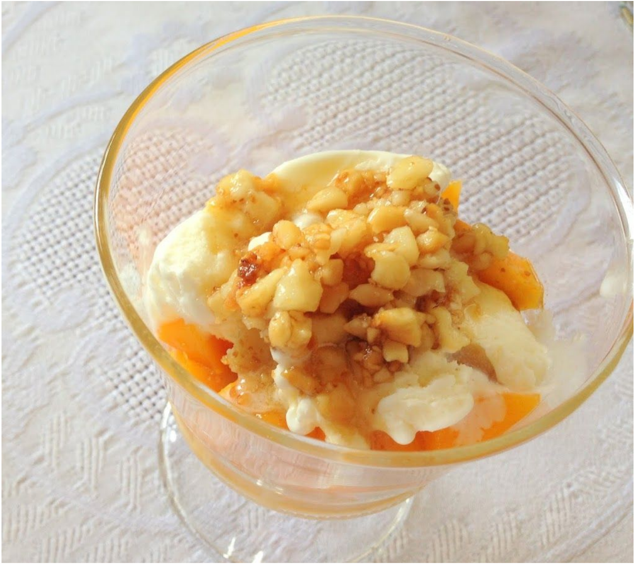
Copa de Yogur con Mermelada de Fresas y Almendra. Sin Gluten.