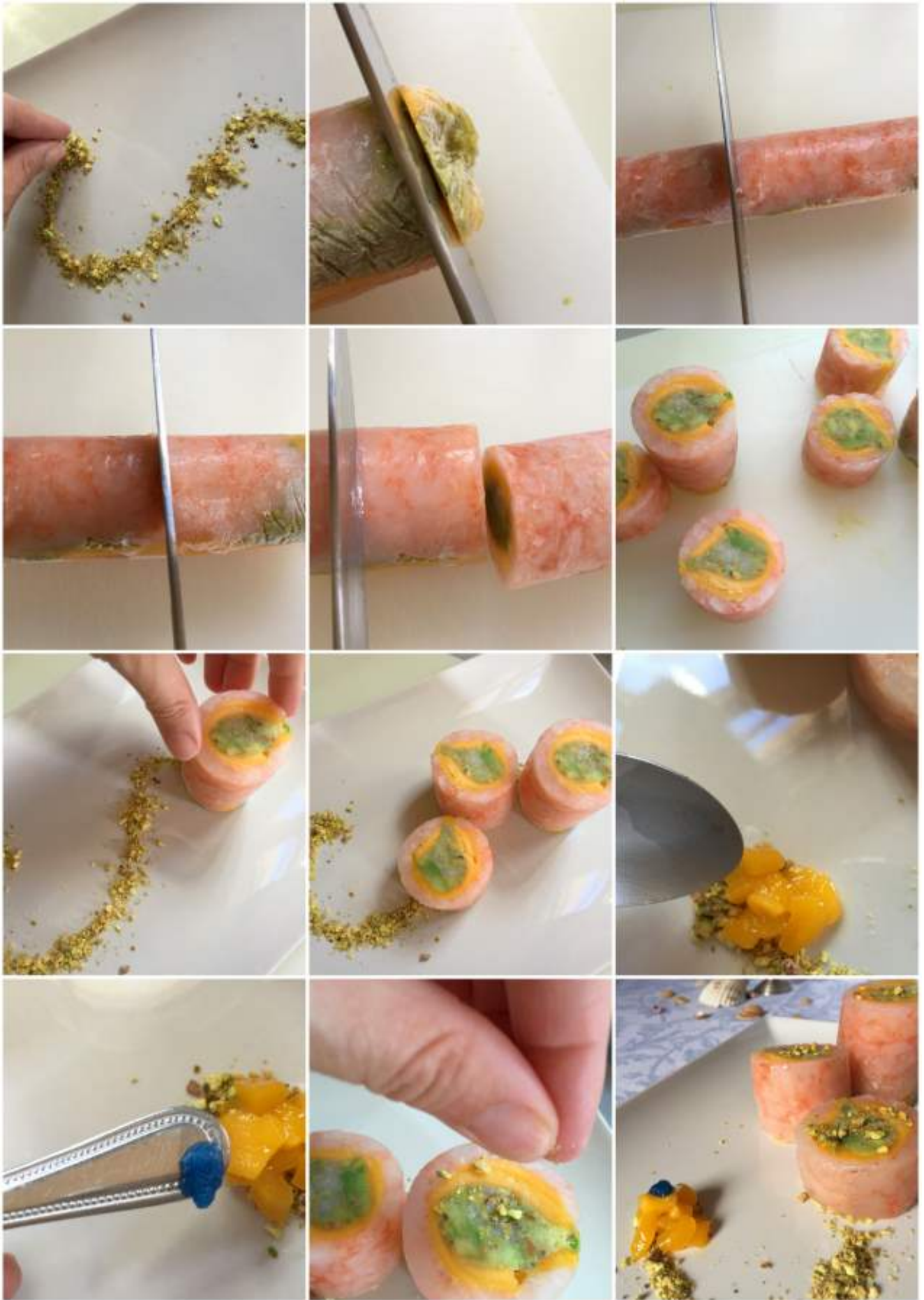
Un plato exquisito, sano y con todo el sabor de mi tierra.