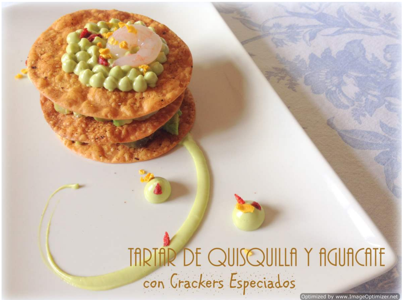
TARTAR DE QUISQUILLA Y AGUACATE con Crackers Especiadados