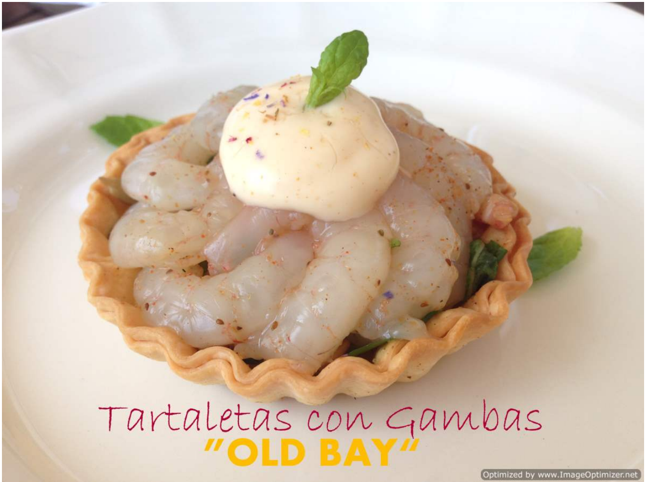
Tartaletas con Gambas "OLD BAY"