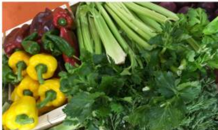
Allí, en los