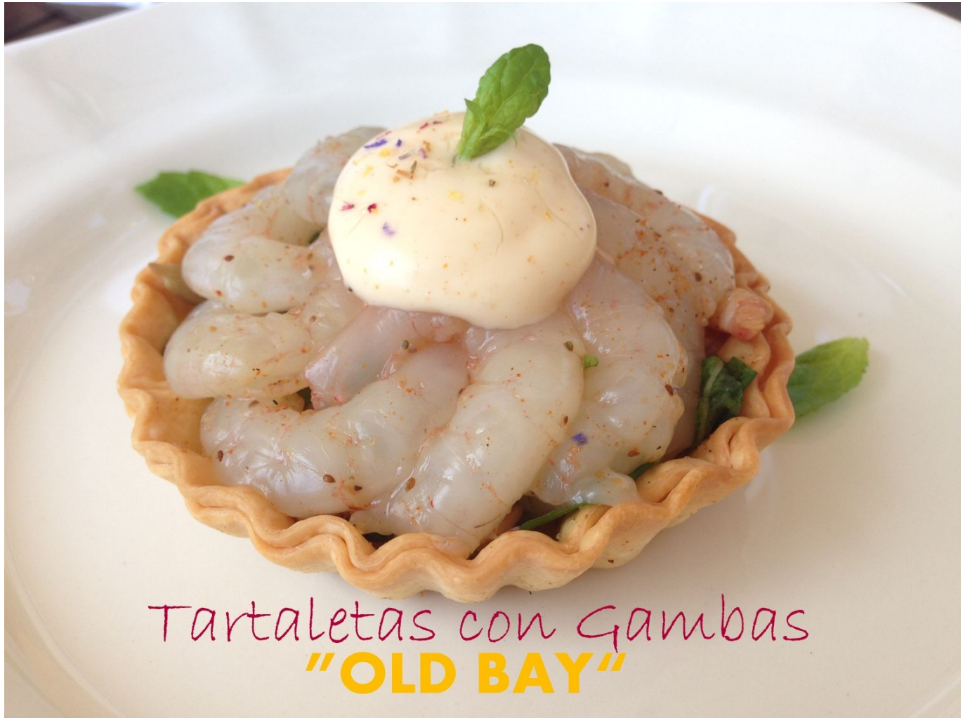
Tartaletas con Gambas "OLD BAY"