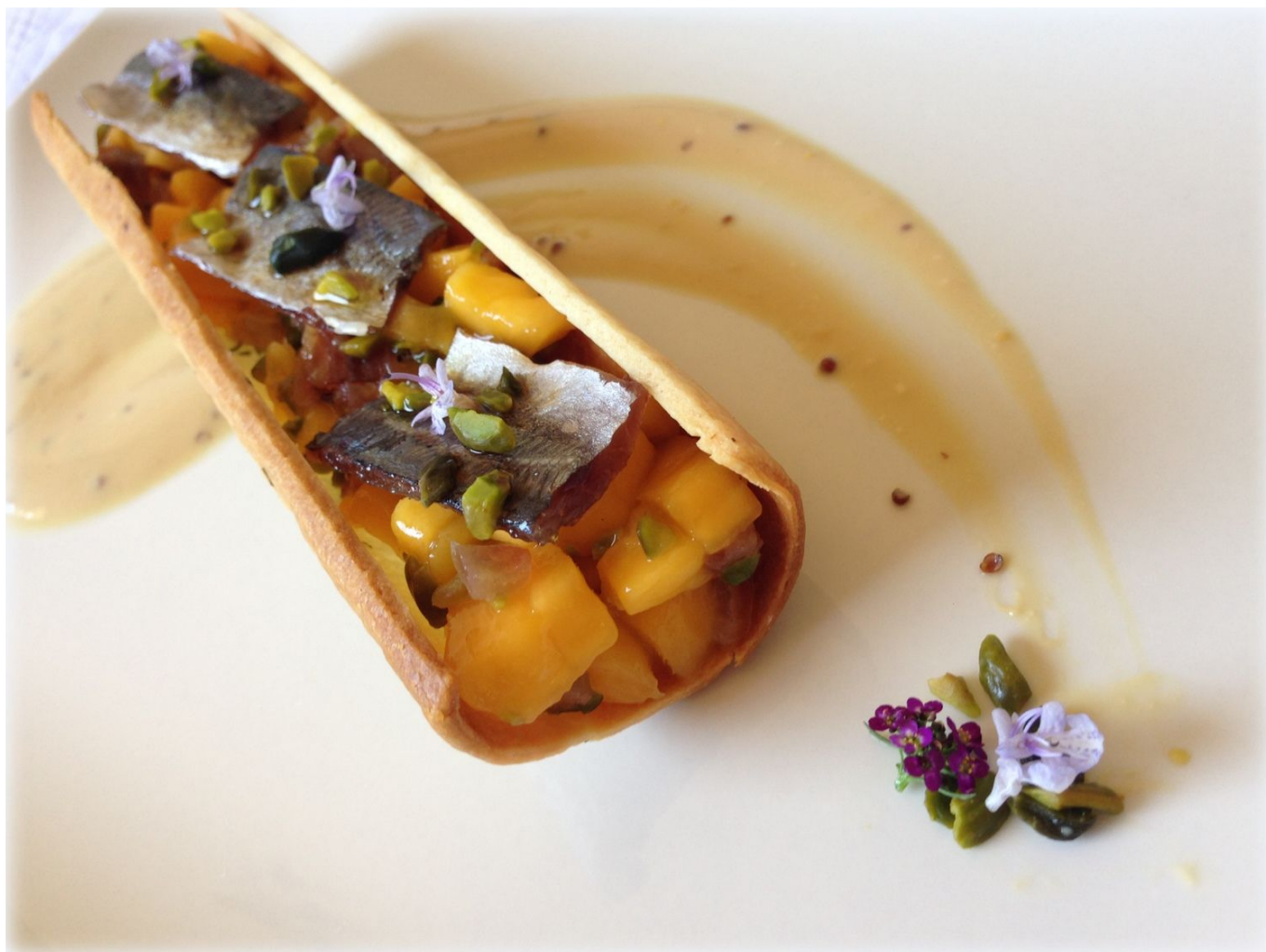
Tartaletas con Gambas