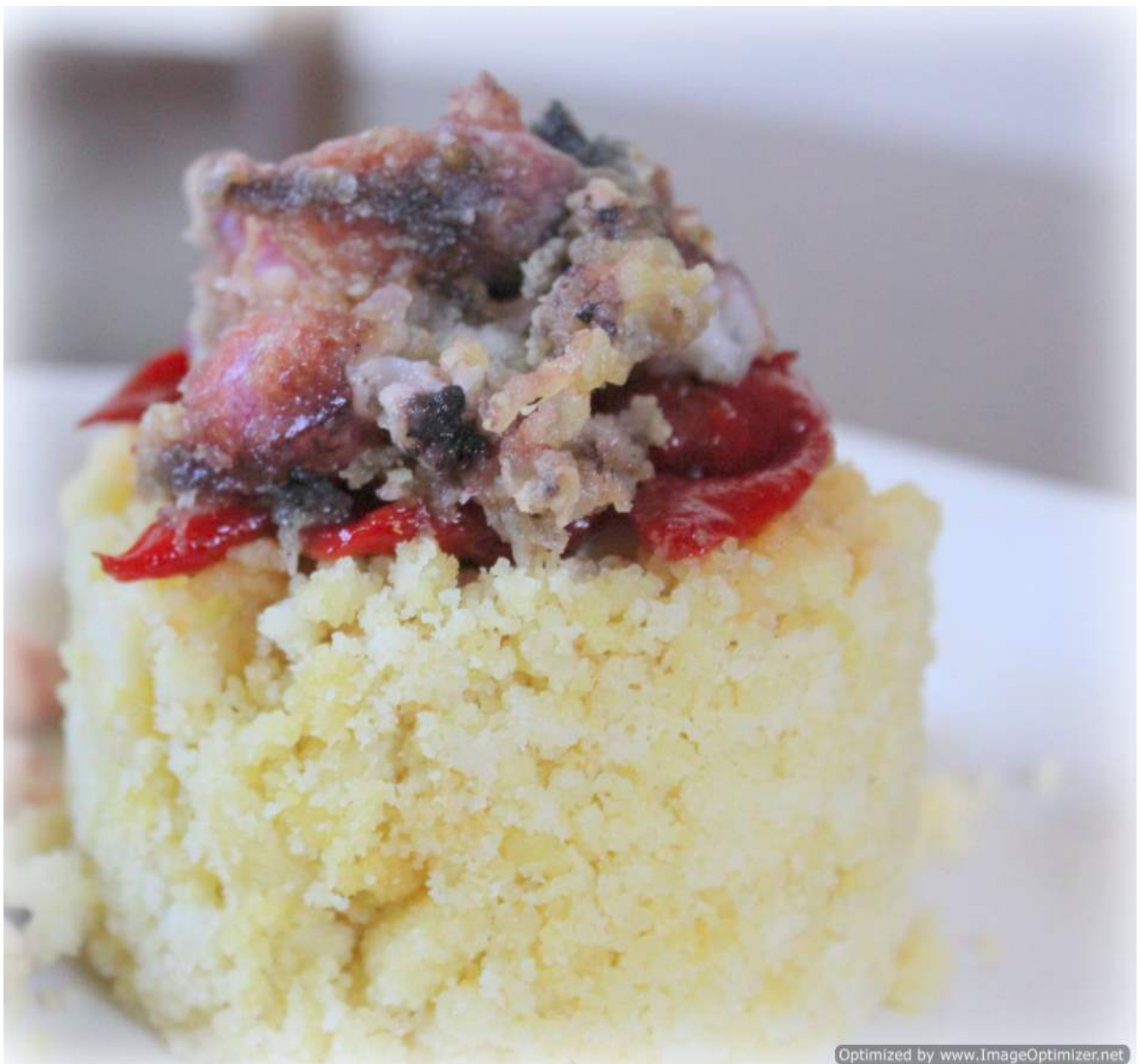
Migas de Harina de Sémola con Pimiento Rojo Asado y Puntillitas de Calamar

Se sirven con engañifa , entendiendo como tal: artificio, señuelo o cebo y que no es otra cosa que el acompañamiento de las mismas; en el que no pueden faltar unos pimientos verdes o rojos, fritos o asados, algo de panceta y chacinas en invierno o pescadito azul en verano. Añade además al coro de ingredientes un buen melón Piel de Sapo y la fiesta está servida.